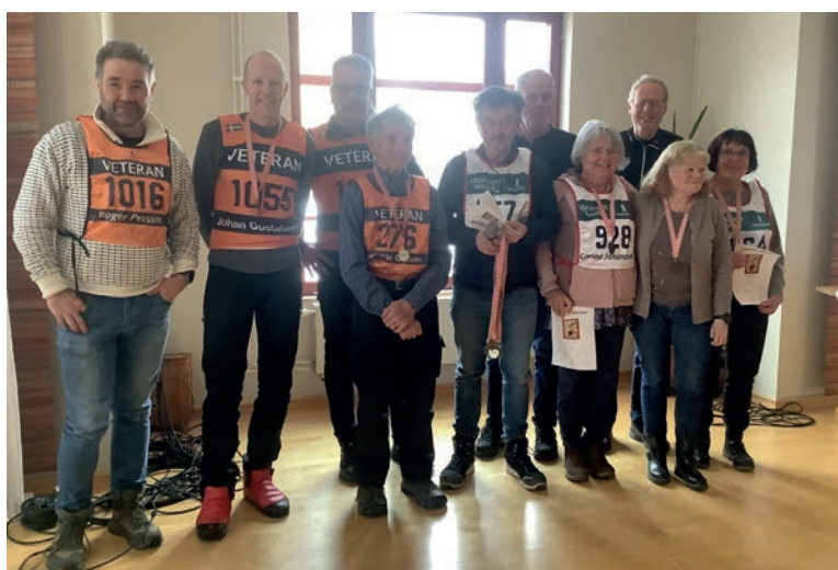
Vasaloppsveteranerna hade 3 lag på Stafettvasan.